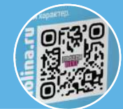
QR код с переходом на продуктовый сайт